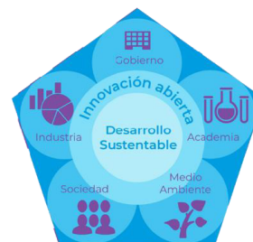
Figura 1. Modelo Pentahélice

Se desarrollará un ecosistema de innovación vinculativo para el país, capaz de articular de manera efectiva los recursos actuales y futuros de Ciencia, Tecnología e Innovación, evolucionando de una triple a una pentahélice (Figura 1), mediante la incorporación de la sociedad y el medio ambiente como elementos fundamentales del modelo (Gobierno-Academia-Industria-Sociedad-Ambiente). De esta manera, se busca generar innovación por medio del desarrollo de conocimiento que integre las necesidades de la sociedad, la economía y la sustentabilidad, haciendo frente a problemas nacionales.